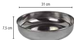
Plato hondo para balanza colgante