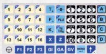
Teclado de recorrido mecánico con tecla tipo cherry.