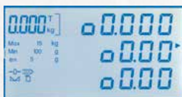
Display LCD de alto contraste